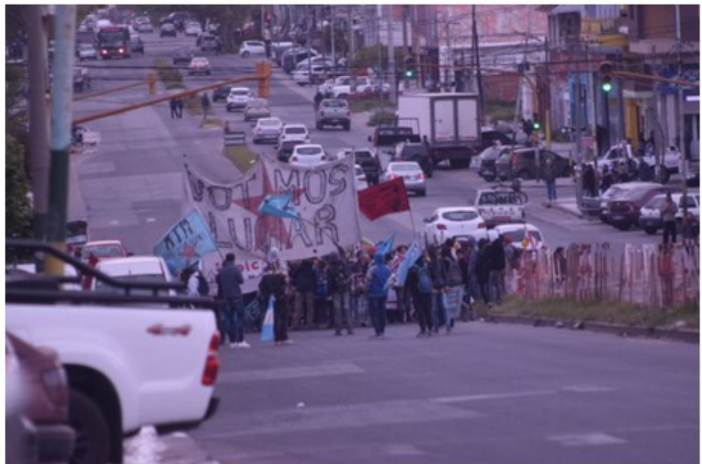
IMÁGENES DE LA CONCENTRACIÓN